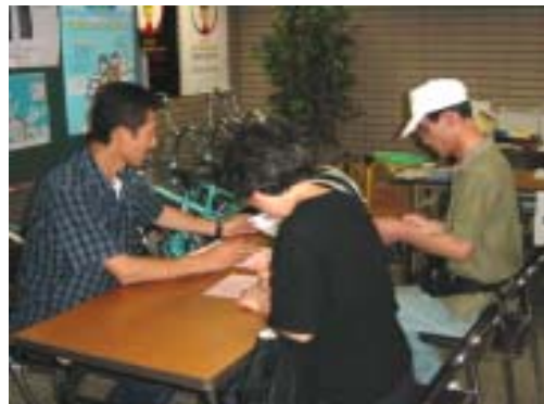
● 社会実験にあわせ駐輪場を設置しました。