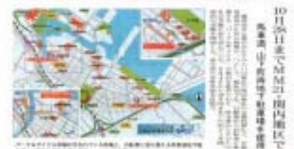
[横浜] 3ヶ月間「パーク&サイクル」社会実験