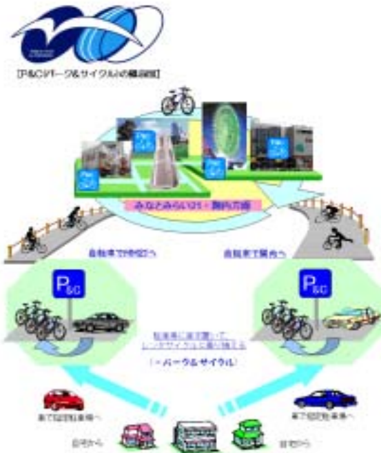
パーク&サイクルの概念図