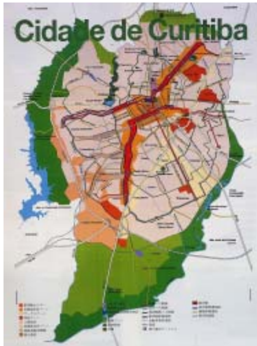
クリチバの土地利用戦略図 赤い線が5本の都市軸