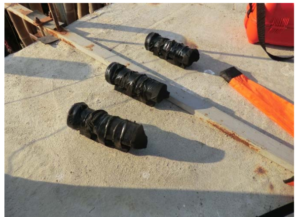
波浪計．盗難防止のため黒布で包んでいる．