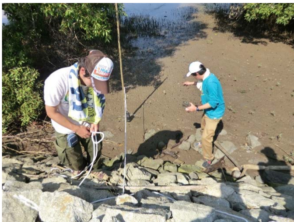
波浪計の設置（陸側）