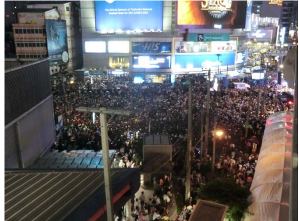
バンコク市内におけるデモ