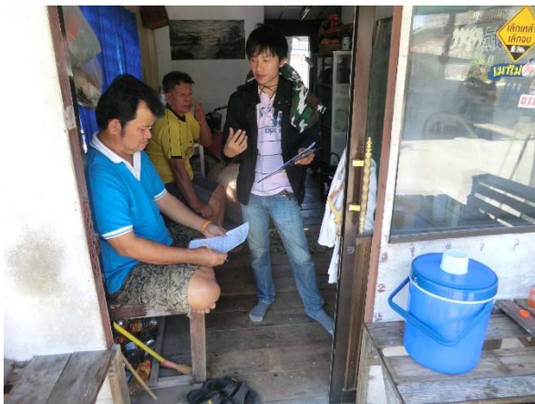
インタビュー調査の様子