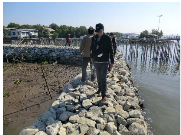
Revetment site での調査