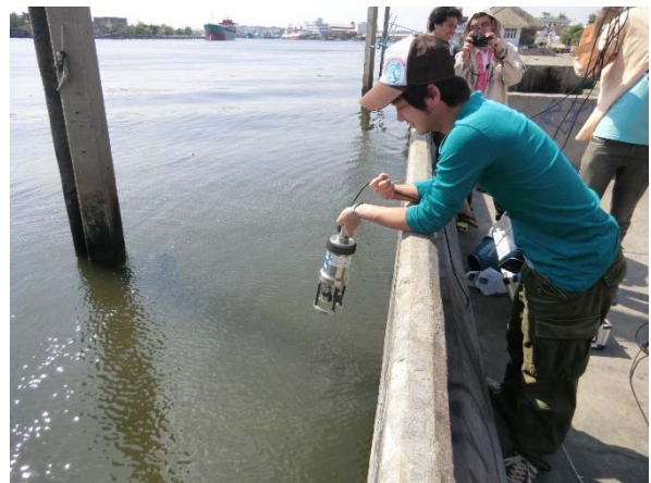
ターチン川での水質調査