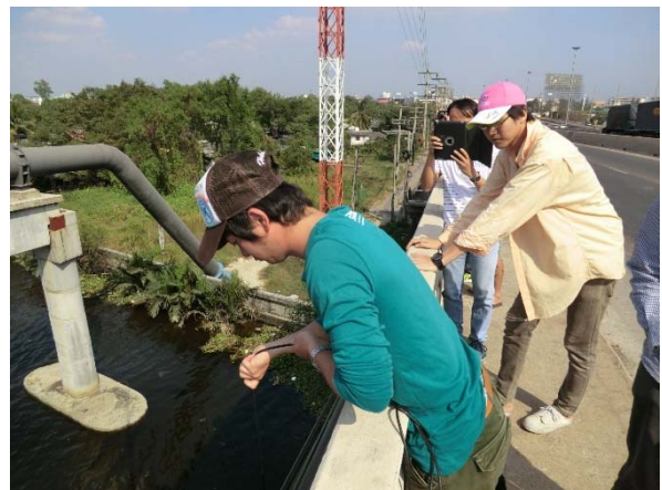
ターチン川での水質調査