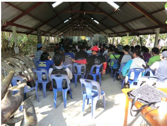
この日はマングローブに関するイベントが行われていた。