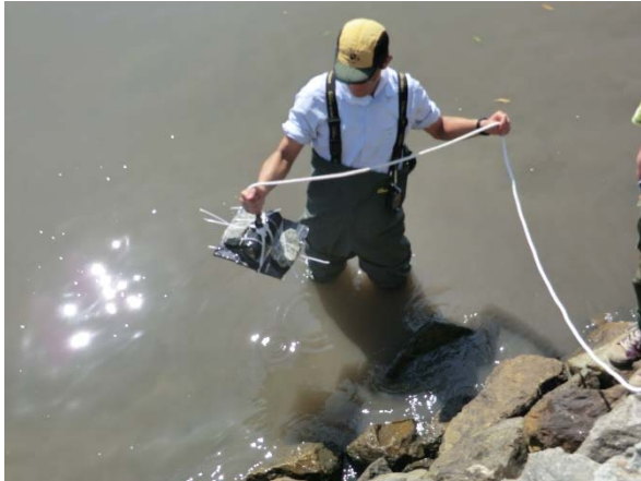
波浪計の設置（海側）