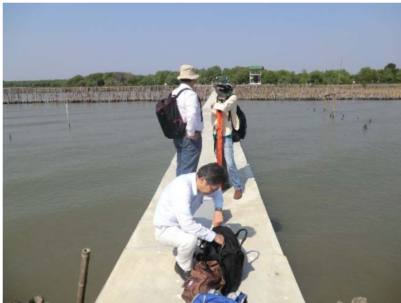
これまでも調査を実施している Bamboo site.